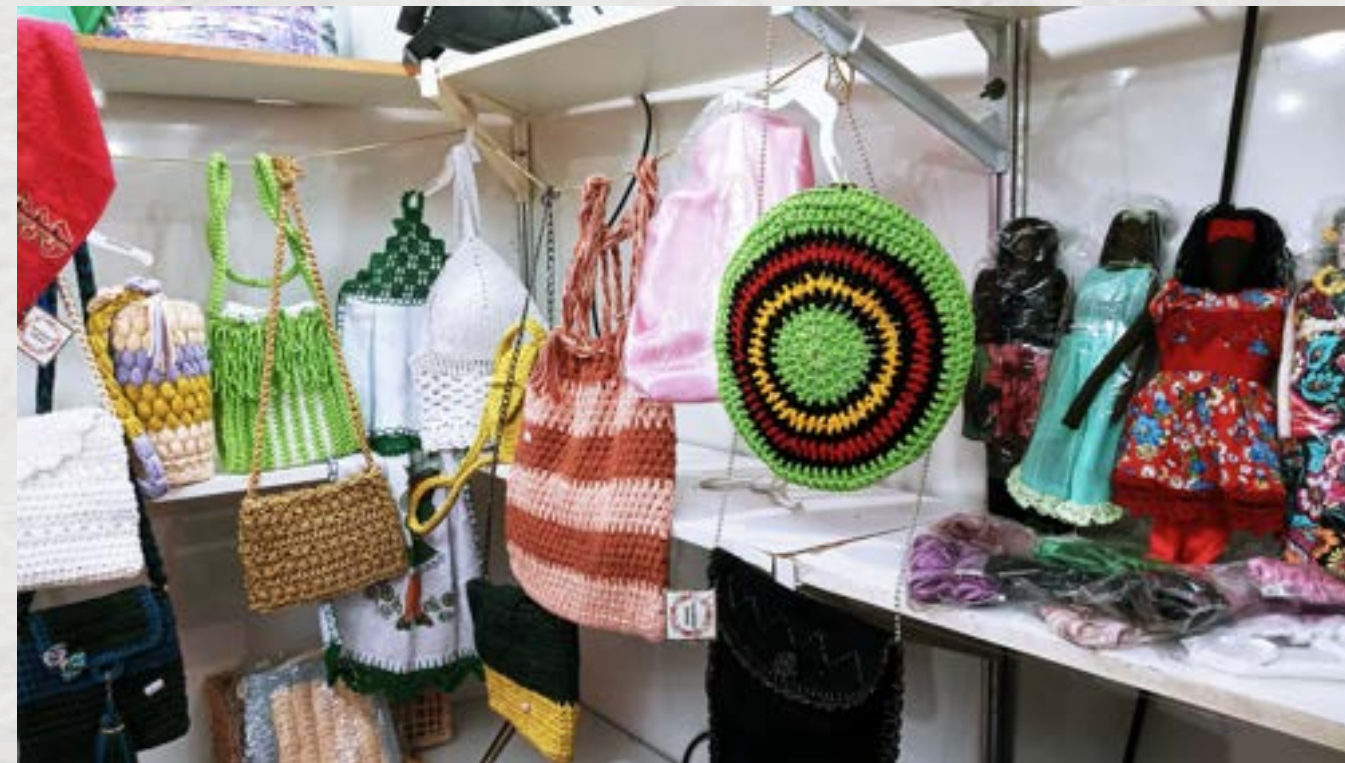
Salão de Artesanato Paraibano no Espaço Cultural José Lins do Rêgo, João Pessoa, PB