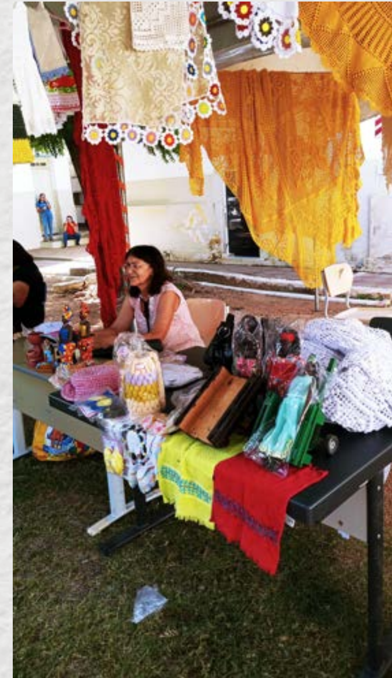
Feira de artesanato na Escola Agrotécnica do Cajueiro