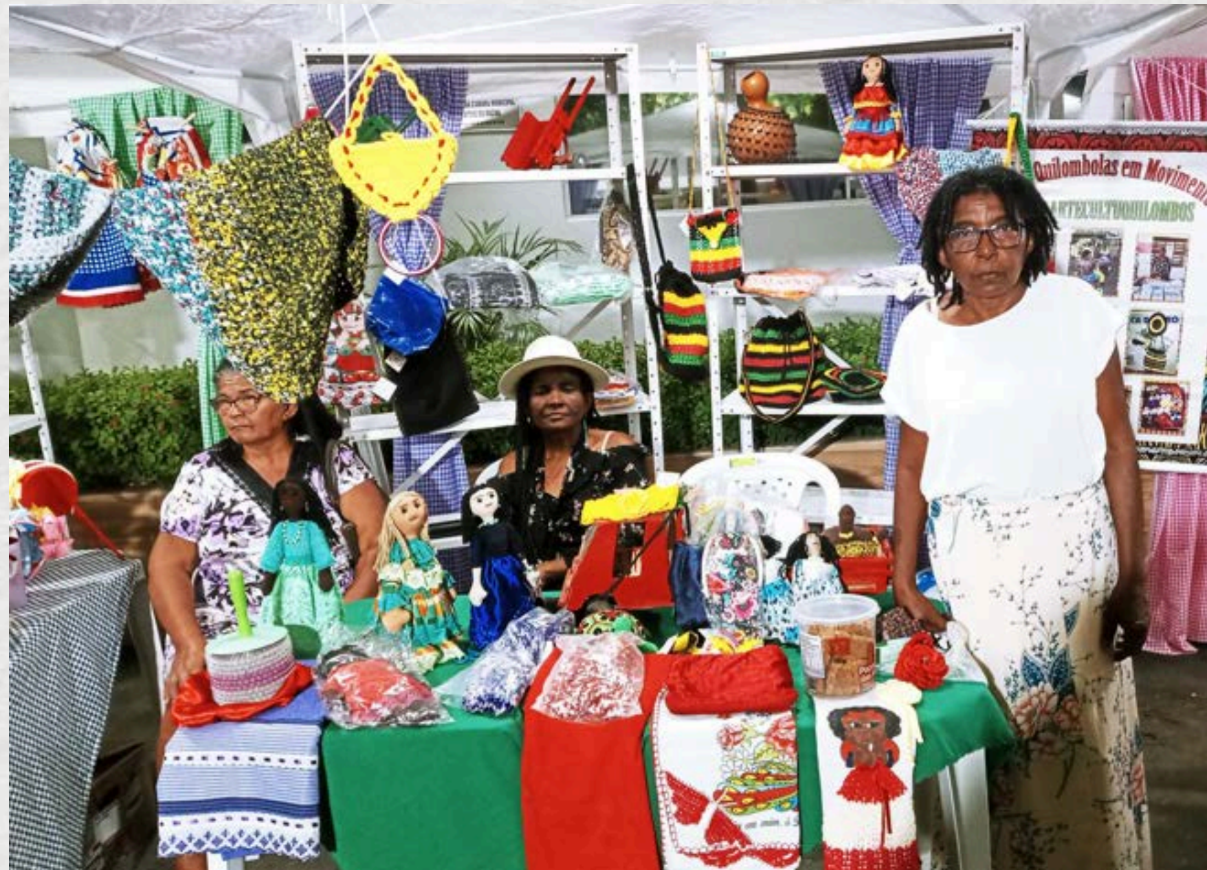
Feira de Arte e Cultura – Praça Gerônimo Rosado, 2022