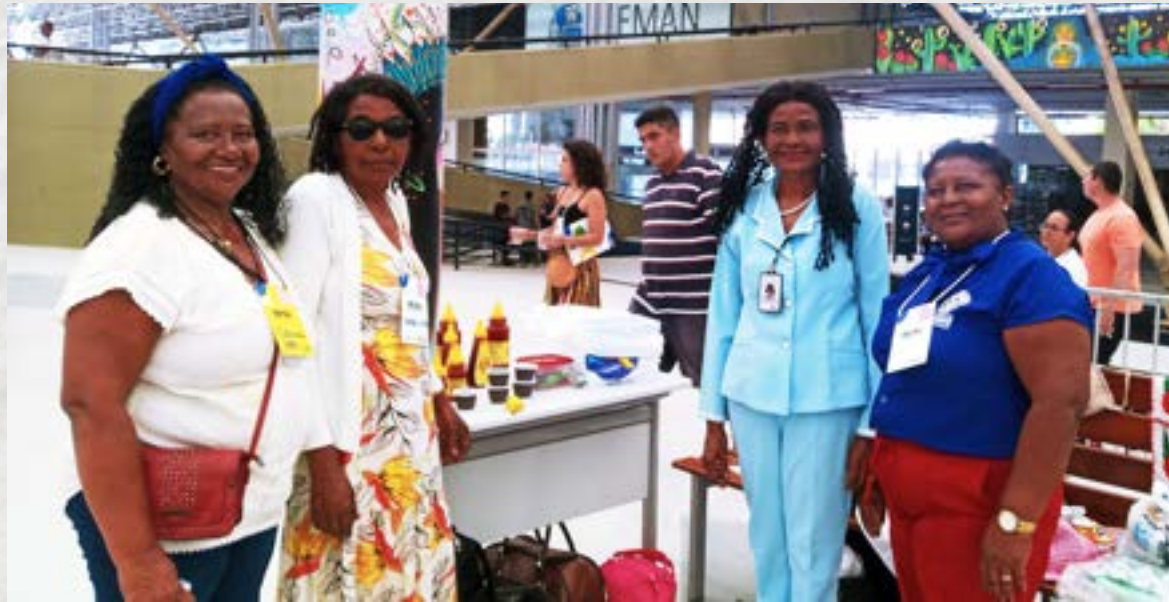
Evento no Centro de Cultura em João Pessoa – PB