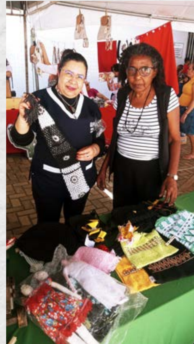
Feira artesanato IFPB