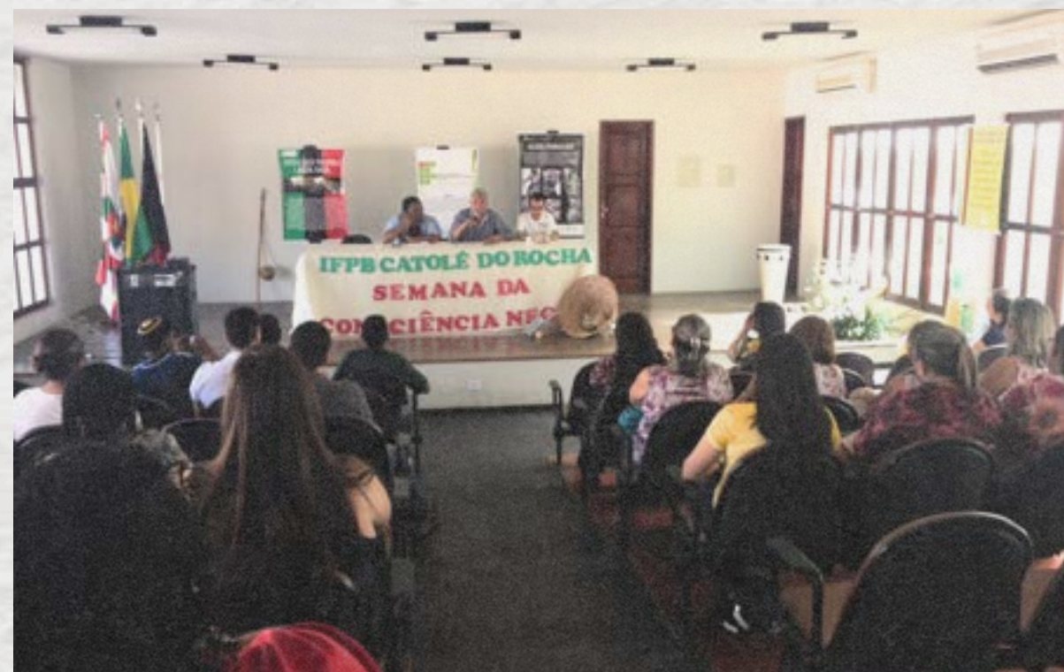
Semana da Consciência Negra, 2015